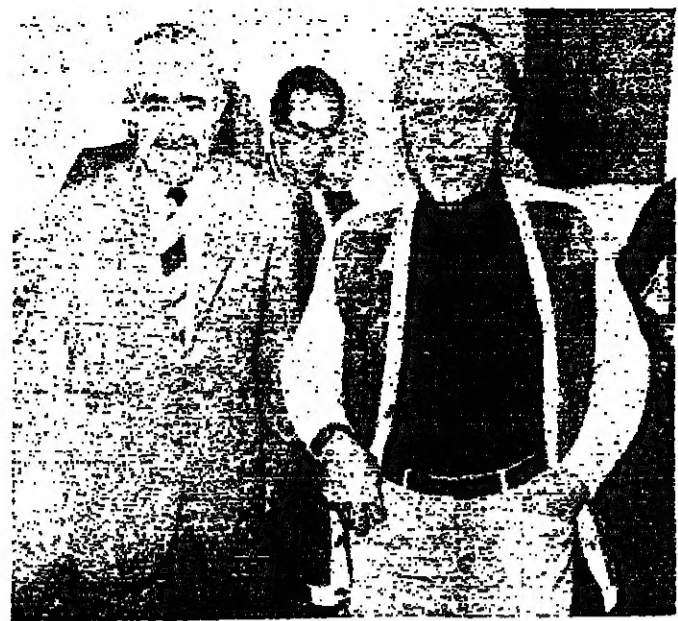
الرئيس سلام وكرامي والمعيد اثناء اجتماعهم امس

أركان التحالف الثلاثي الرئيس سلام وورشيد كرامي والمعيد اده ، اضافة الى وزير امس في سلام ، جرى خلاله عرض وضع المباحث في البلاد ، وتناقش شارات الرسمية لتكامل الشارقي.